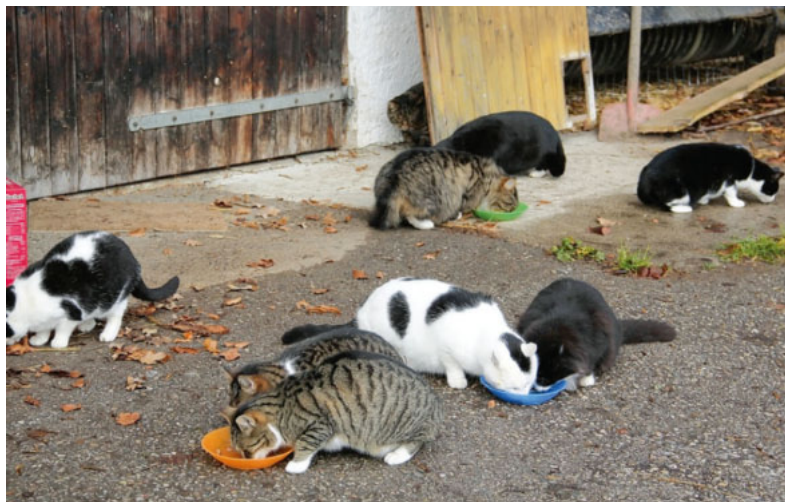
Nur Katzen, die regelmäßig gefüttert werden und gesund sind, sind schnell genug, ihre „Arbeit“ zu erledigen und die Mäuse zu erwischen.

Das Leben einer Bauernhofkatze beschreibt die Bäuerin auf der Internetseite http://bauernhofkatzen.de .