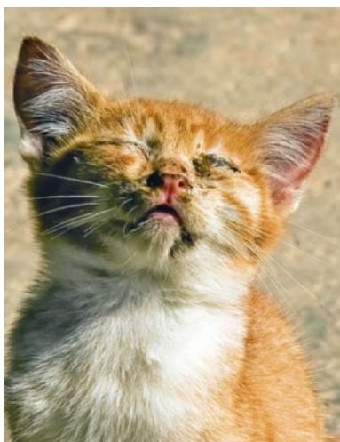
Katzenschnupfen ist die häufigste und offensichtlichste Erkrankung bei streunenden Katzen und sehr ansteckend.

„entsorgt“. Sind sie lange genug versteckt, fristen sie ein klägliches Dasein. Viele junge Kätzchen verenden bereits nach wenigen Monaten elendig. Diejenigen, die erwachsen werden, erreichen durchschnittlich ein Alter von drei bis vier Jahren – kastrierte, gut versorgte Katzen leben 15 Jahre und länger.